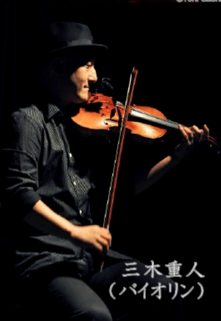
三木重人 (バイオリン)